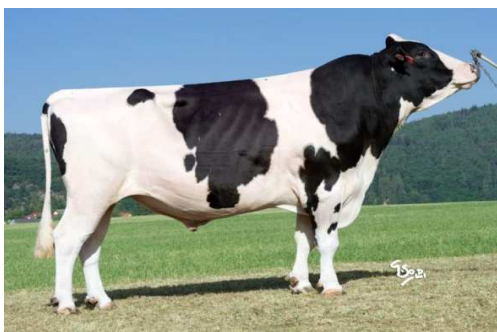
polobratr matky Monaco