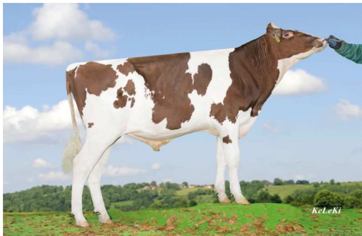
otec: Apoll P