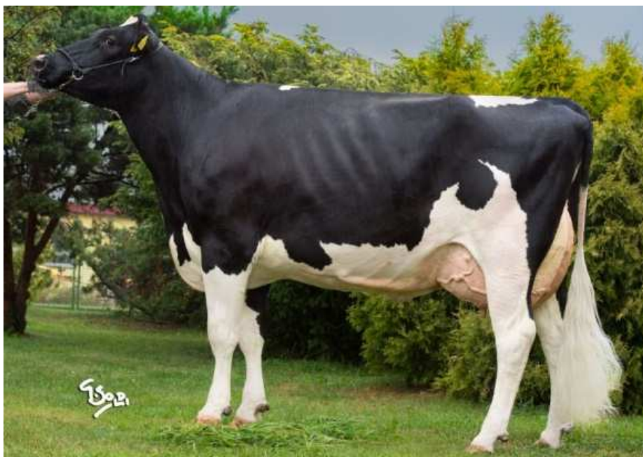
Matka: Ostretin Genua 26 VG 86

Z rodiny Genua s vynikajícím obsahem mléčných složek s prověřenými matkami v domácích podmínkách