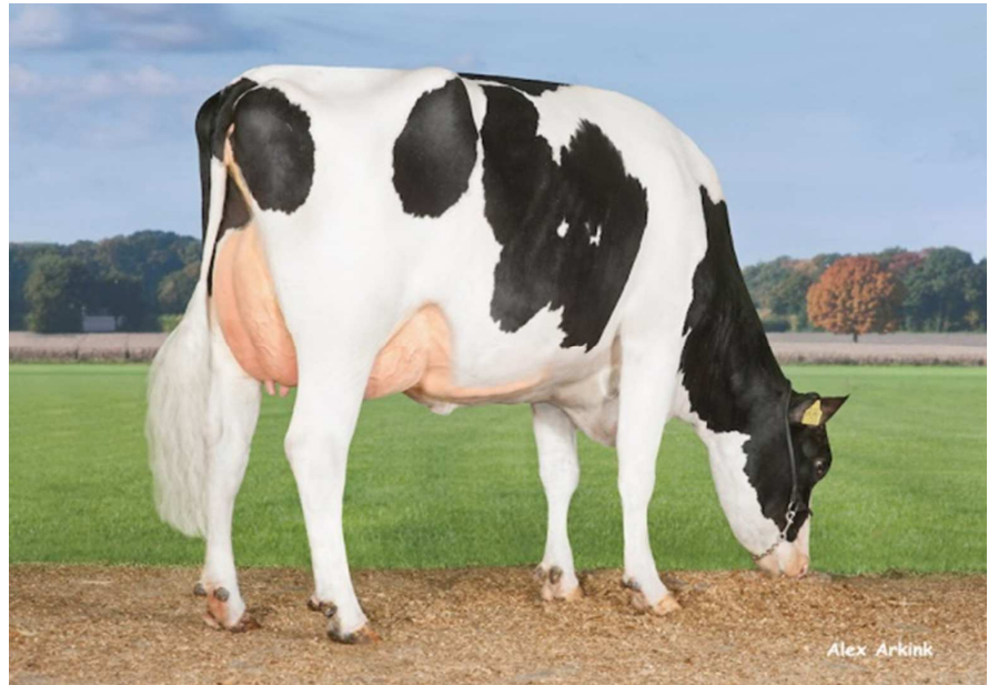
Matka: DG Caley VG 87