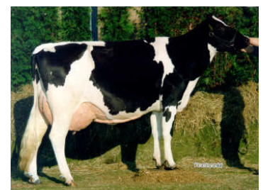
MMMMM: Grietje 79 VG 89