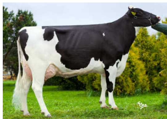
Matka: Ostretin Genua 2 G+84