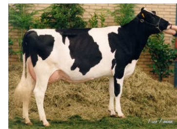
MMMM : Grietje 80 EX 90