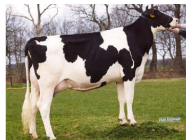
MMM : Genua VG 87