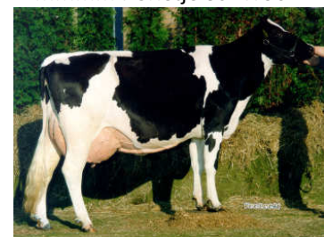
MMMMM : Grietje 79 VG 89