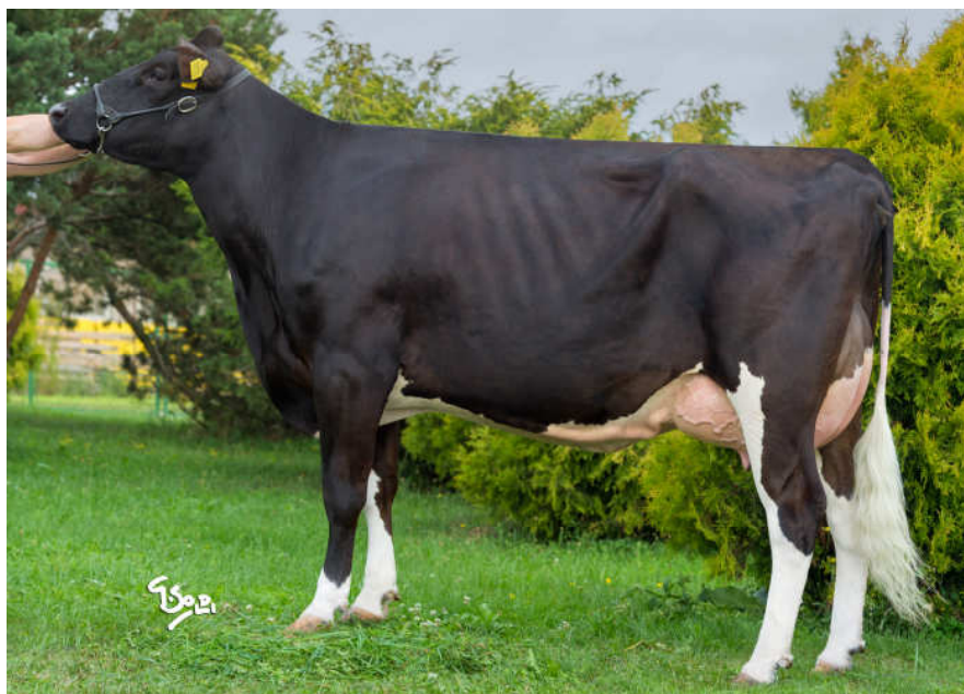
Matka Pikanta: Ostretin Genua 5 G+84

Iota x G+84 Sandy x VG 85 Ramos x G+84 Oman x VG 87 Aaron x EX 91 Esquimau