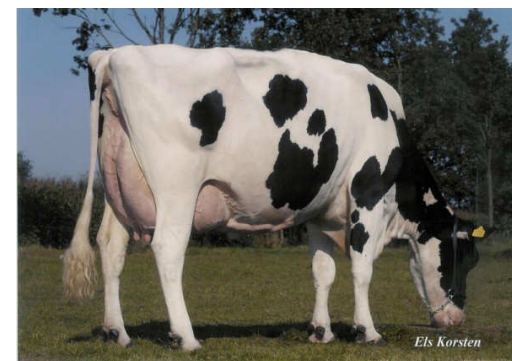
Matka matky: Petunia VG 89