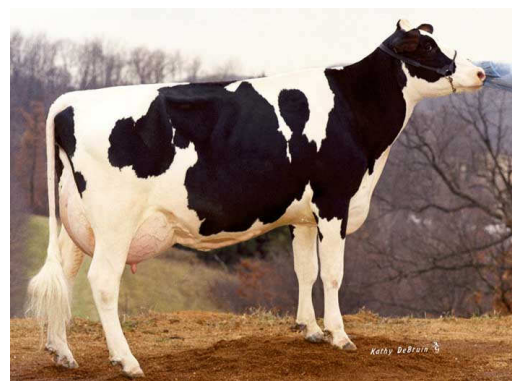
MMMM : Mar-River BW Orange VG 87