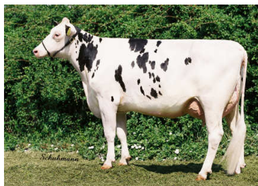
Matka: Ostretin Petunia 1 VG 88