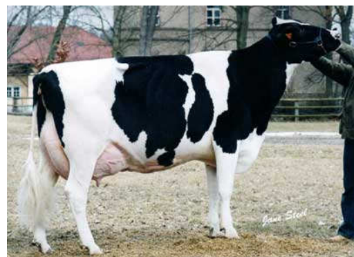
MMM : Alta JR Orié EX 92