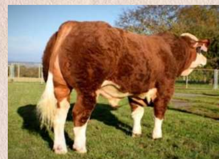
ISI-401 Epik P