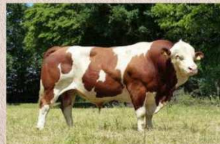
Otec matky Ursus