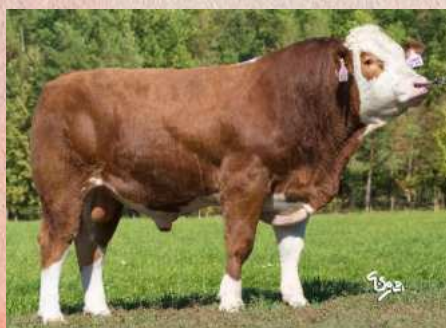
ISI-133 Dingo P