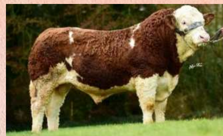
ZMS-691 Gunshot P