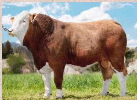
ISM-011 Grál P