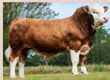
ISI-936 Kolisi P