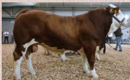
ISI-406 Hamilton PP