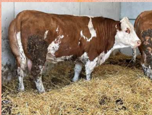
Matka Curaheen Angel

Matka Nuta je Curaheen Angel , která byla při výprodeji farmy Curaheen prodána za 12 000 euro. Angel je kráva s obrovskou pánví a skvělým osvalením kýty. Nut zaujme především svou délkou těla, pánví a harmonickým osvalením. Doporučujeme jej na krávy, u kterých potřebujete zlepšit osvalení a pánevní rozměry.