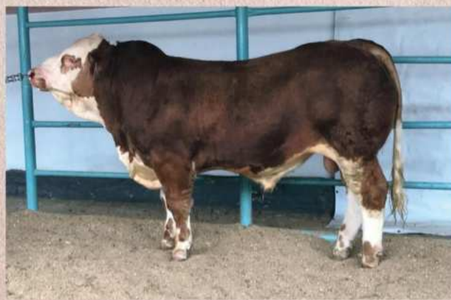
Flop během výběru plemenitby