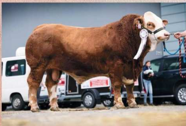
Plný bratr Flopa

růst v maternálním efektu 127. Její syn Disk Agrochyt jako historicky první simentálský býk dostal 90 bodů za exteriér a na Národní výstavě byl oceněn jako nejlepší mladý býk napříč všemi plemeny. Rok poté její další syn Endy Agrochyt P* překonává tento rekord - 92 bodů. Sám Flop dostal za exteriér 84 bodů, byl hodnocen pouze v 13. měsících stáří. Dosáhl hmotnosti ve 120 dnech 282 kg, ve 210 dnech 455 kg a v 365 dnech 766 kg. Plemenná hodnota pro růst v přímém efektu je 138!