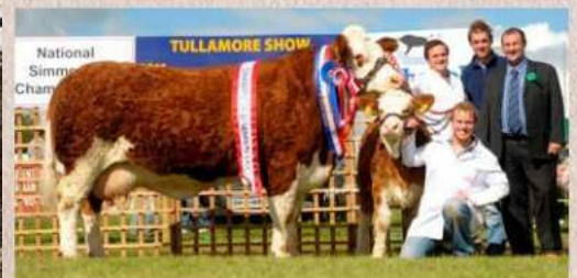
Sestra matky Kabooma