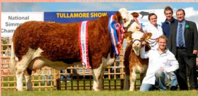
Matka matky Henryho

Pokud se ptáte, kde je největší přednost Henryho, tak je to určitě šířka pánve a osvalení zádě, troufáme si říci, že u býka, který prošel českou odchovnou, doposud nevídané. Vynikající harmonie exteriéru, plášťově červené zbarvení, skvělý temperament a perfektní původ z něj dělají TOP býka, který určitě bude hojně použit nejen v ČR, ale pevně věříme, že bude populární i v zahraničí. Henry dostal při výběru do plemenitby 82 bodů za exteriér. Má výbornou PH pro růst v přímém efektu (116).