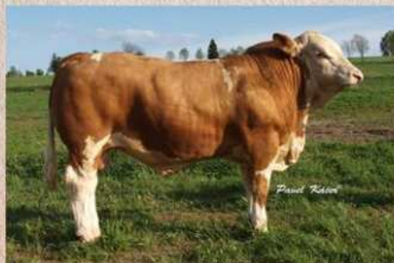
Otec otce Uman Vodňanský