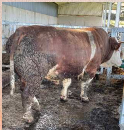
Otec Tulla Jaguar P