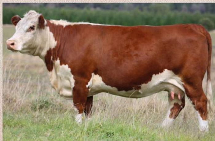
Matka býka Showtime