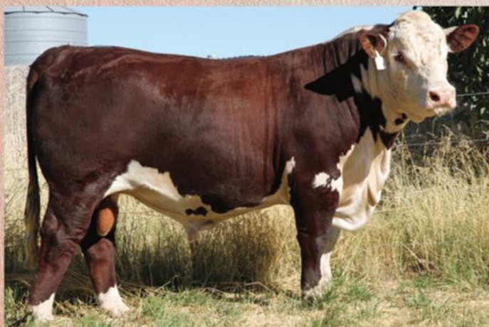
Otec býka Showtime

farmě Mawarra, její první syn Rhinestone byl prodán za 40 000 $. Showtime také patří do nejlepších 10% populace pro mléčnost. Nabízí naprosto kompletní profil plemenných hodnot, což ho v kombinaci s jeho nepřibuzným původem předurčuje k rozsáhlému použití na naší populaci.