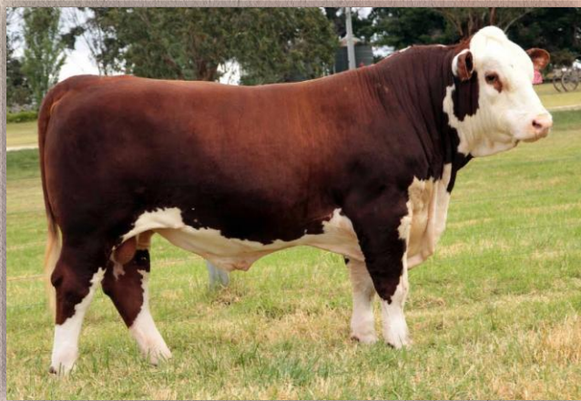
Tycolah Jovial F77 x Bowen Vincent V1