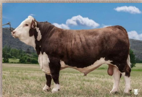
Mawarra Mustang x Laerkedal Ingermand

Jedná se o jednoho z prvních synů australského býka Mawarra Mustang v ČR, jehož potomstvo je velice úspěšné po celém světě. V současné době je TOP 2 pro růst v přímém efektu. V pozici otce matky najdeme dánského býka Laerkedal Ingermand, který má velmi mléčné dcery. Gerd při základním výběru obdržel 86 bodů za exteriér, kdy nejnižší známka byla 8, což svědčí o jeho celkové vyrovnanosti. Hmotnost ve 120 dnech byla 256 kg, ve 210 dnech 378 kg a v roce 639 kg! Gerd má vynikající plemenné hodnoty pro exteriér, tak i pro růst v přímém efektu (137, TOP v ČR). Gerd je býkem, který by měl dle našeho názoru posunout populaci hereforda v ČR o velký krok dopředu.