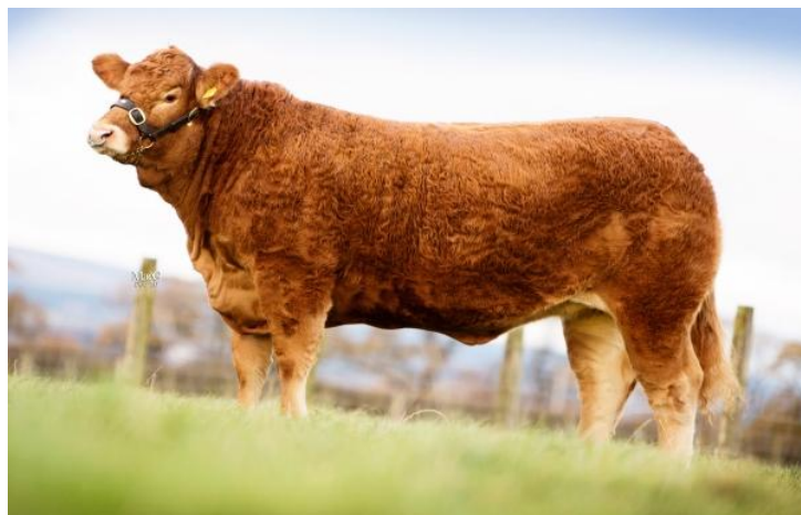
Dcery Hinze PP