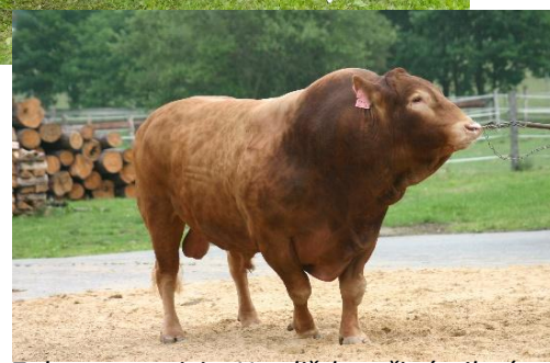
Zako na stanici v Hradištku, třináctiletý