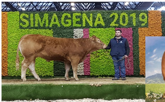
Dcera býka Gauloi Eba na výstavě SIMAGENA 2019 v Paříži