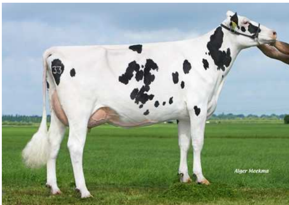
Matka matky K&L SG Dellia VG-86

Kompletní plemeník z vynikající rodiny matek býků Southland Dellia