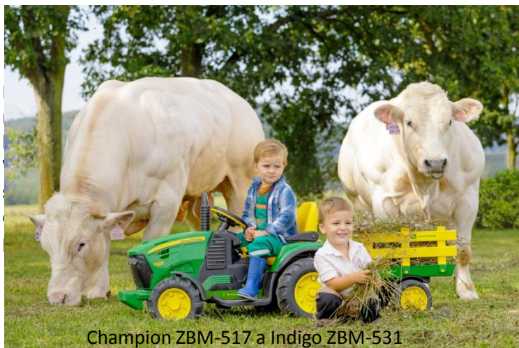
Champion ZBM-517 a Indigo ZBM-531